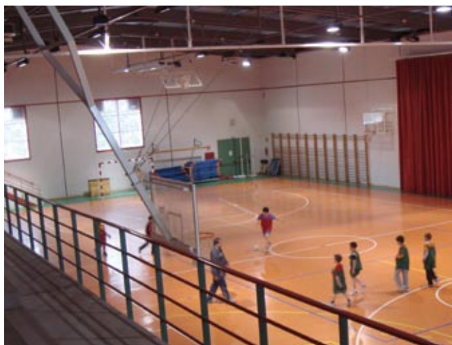
Polideportivo Barrio Norte

Es importante destacar la cantidad de equipos y entidades que quieren desarrollar sus campus y stages deportivos en nuestras instalaciones, así como los eventos que el propio Ayuntamiento está incentivando y orientando para el desarrollo del deporte base, generando una alta ocupación turística en periodos de temporada baja.