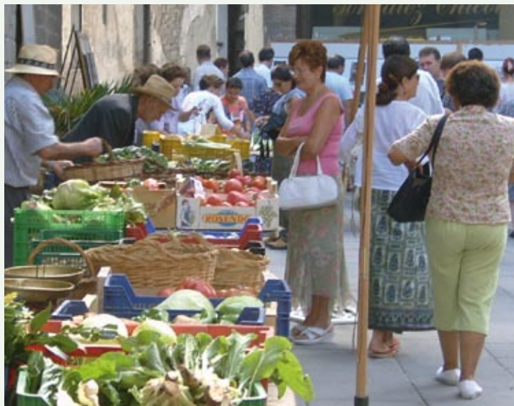
Mercado de las Huertas de Jaca

Siempre, la cultura se ha forjado como uno de los elementos más igualitarios de la sociedad. Crear, expresar emociones y dejar constancia de su paso por este mundo, ha sido un apasionante reto para los hombres y mujeres de todas las épocas.