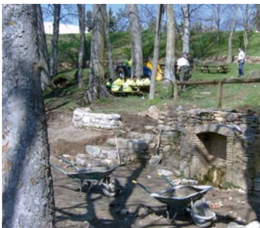
Recuperación de la Fuente de Furranchinas

Los espacios verdes constituyen el reflejo de la cultura social de una ciudad. Por eso una de nuestras prioridades ha sido la recuperación y mejora de zonas como: Paseo de la Constitución, Paseo de la Cantera, Parque de San Lure, Parque de Membrilleras, Jardines de Sesé y Castillo, los Glacis de la Ciudadela, el Boalar, etc. Instalando mobiliario de calidad, iluminación, parques infantiles y un sistema moderno de riego, utilizando técnicas de goteo y aspersión con uso de agua no potabilizada. Esto nos ha situado a la cabeza de las poblaciones con más espacios verdes por habitante ya que hemos pasado de 17 a 50 hectáreas, lo cual ha supuesto una importante inversión tanto en medios humanos como en la adquisición de todo tipo de maquinaria. También se ha recuperado la red de agua de San Salvador, que da servicio a las fuentes públicas de la ciudad.