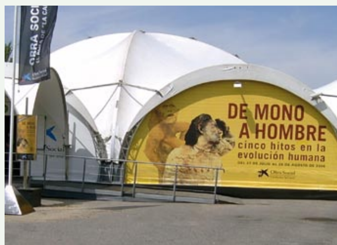
Exposición en el Llano de Samper

Adquisición de nuevo patrimonio cultural: 2.017.432 €