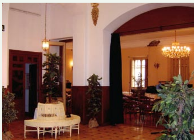
Casino de Jaca