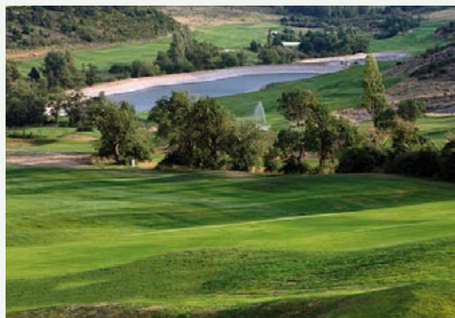
Campo de Golf de Badaquás

No podemos obviar la importancia que para nuestro municipio tiene la apertura del campo de golf de Badaquás, al ampliar la oferta turística y deportiva de nuestro territorio en el que además de los deportes de invierno podemos disfrutar de un magnífico medioambiente y lo que eso supone como atractivo turístico.