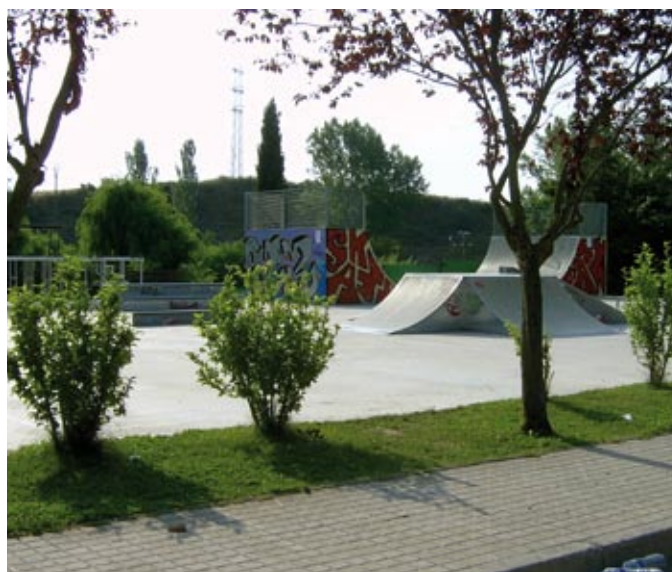
Pista de patines

Con un incremento importante de las inversiones en política deportiva en los presupuestos municipales, las nuevas instalaciones van a constituir un aporte de calidad, más allá de lo estrictamente deportivo, como ya vimos durante el FOJE con las visitas a la nueva pista de hielo. Esto nos llevará a aumentar el atractivo que tiene nuestra ciudad en el exterior.