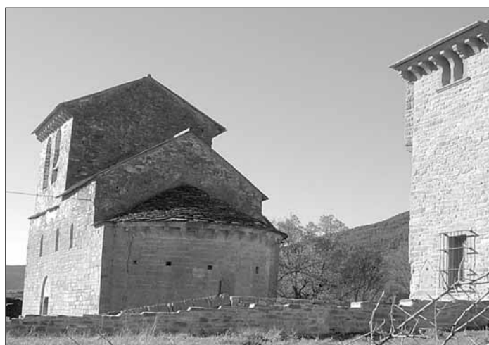
Iglesia de San Pedro en Caniás

Esta edición del Ecomuseo de los Pirineos incluye 10 rutas, 4 más que el pasado año, de las que 6 se programaron en temporada alta y 4 en temporada media, con la idea de dar un paso más hacia la desestacionalización del sector turístico. Aunque el objetivo a medio plazo es que las rutas puedan organizarse en fechas de temporada baja, cuando se hace más necesaria la existencia de una oferta complementaria". De las 10 rutas, 3 pertenecen a la serie "La vida en los Pirineos"; 3 se incluyen en la serie "Creencias Populares"; 2 en la serie "Caminos de Piedra" y 2 pertenecen a "Riquezas Naturales". En total se visitan 16 pueblos y la ciudad de Jaca. El objeto principal del Ecomuseo de los Pirineos es fomentar un turismo rural respetuoso con las peculiaridades de los pueblos y de las gentes que integran este territorio, para asegurar un desarrollo sostenible del valle del Aragón.