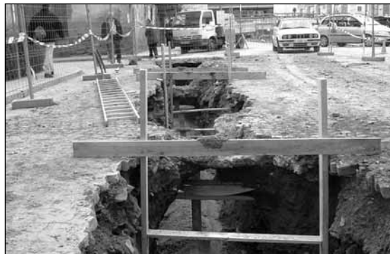
Obras de reparación de una fuga de agua en el Casco de Jaca

El Ayuntamiento de Jaca ha encargado a la empresa especializada Aguas de Valencia la realización de una auditoria técnica para detectar las fugas que se producen en la red de abastecimiento del casco urbano, que suponen pérdidas importantes y contribuyen a aumentar el gasto de agua de boca. Además se va a continuar con la instalación de contadores de agua en centros públicos, instalaciones municipales, colegios, establecimientos hoteleros y piscinas. Además, se están tomando otras medidas en los últimos meses: los trabajos de peatonalización del casco antiguo y la instalación de gas ciudad se aprovechan para renovar todas las conducciones de agua, se ha realizado un inventario de usos agrícolas y de ocio y se ha implantado el riego por aspersión, con agua no