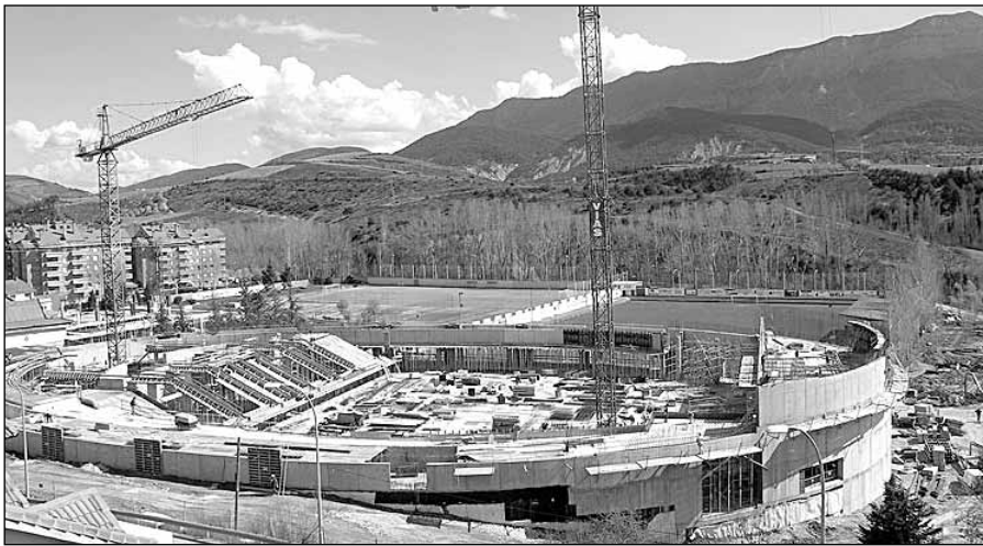
Las obras de la nueva pista de hielo avanzan a buen ritmo