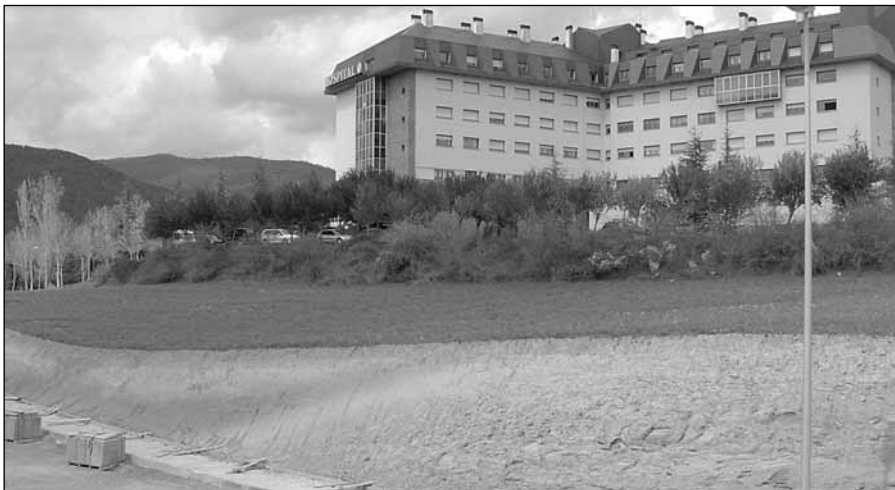
Terrenos donde se construirá la nueva Residencia y Centro de Día de Jaca