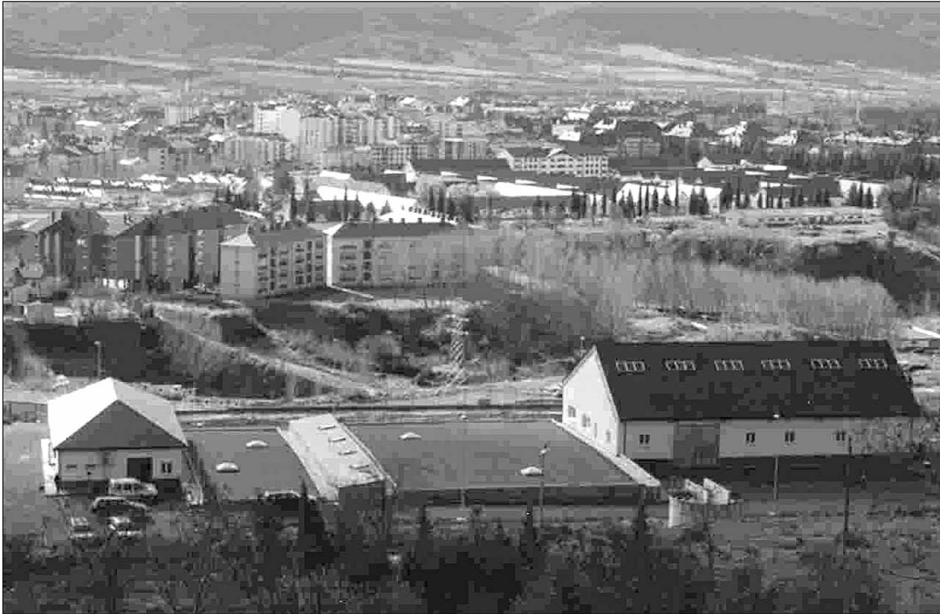
Planta potabilizadora de Jaca situada en la ladera de Rapitán

La planta potabilizadora de Jaca, que funciona a pleno rendimiento, tiene una capacidad para abastecer a una población de 62.000 personas, con un caudal de tratamiento de 26.250 metros cúbicos al día. Con un plazo de ejecución de 33 meses, el presupuesto de construcción fue de 5.577.743'13 euros y en obras complementarias se han invertido más de 900.000 euros.