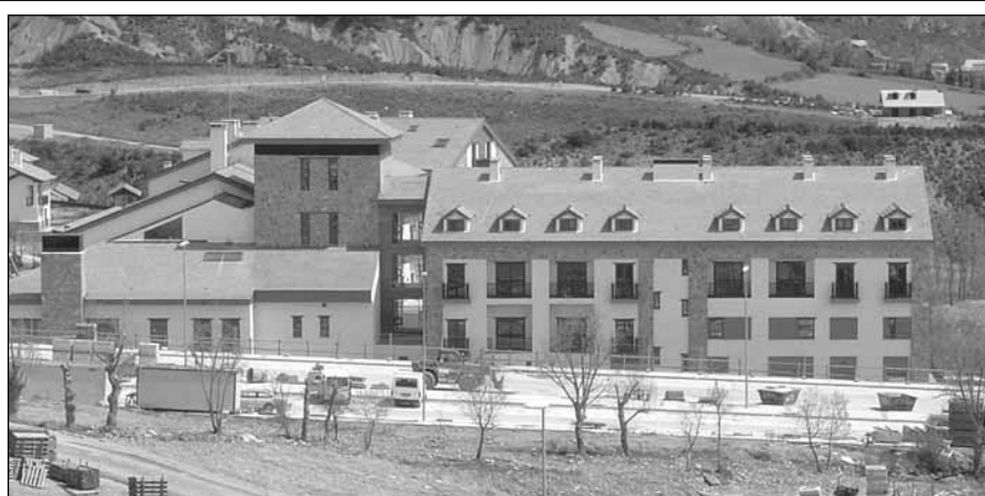
Hotel de cuatro estrellas de Badaguás que se inaugurará este verano

El campo de golf de 18 hoyos de las Lomas de Badaguás se inaugurará el próximo mes de junio. Los vecinos de Jaca tendrán facilidades para iniciarse en el deporte del golf en el nuevo campo, según figura en los compromisos adquiridos por Fadesa y el Ayuntamiento de Jaca. El hotel de montaña de cuatro estrellas de Badaguás estará plenamente operativo en verano.