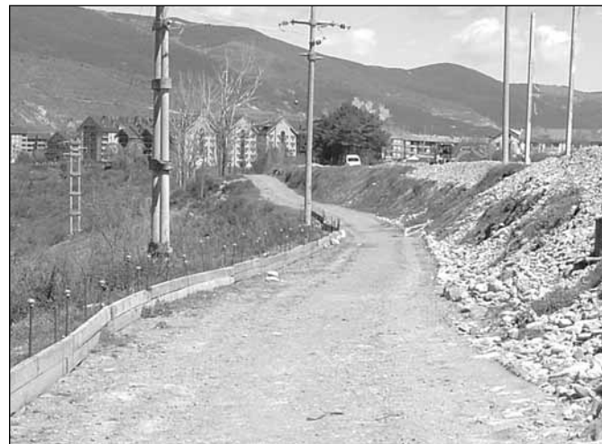
Camino de Monte Pano

El Ayuntamiento de Jaca ha aprobado la adquisición de placas para las calles de los núcleos rurales del término municipal. Se colocarán 221 placas en los pueblos de Binué, Abena, Ascara, Orante, Guasa, Jarlata, Abay, Asieso, Botaya, Novés, Ara, Banaguás, Bernués, Barós, Ipas, Navasilla, Osia, Las Tiesas Altas, Las Tiesas Bajas, Fragonal y Badaguás.