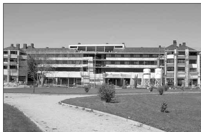
Nuevo hotel de cuatro estrellas situado en el Llano de la Victoria