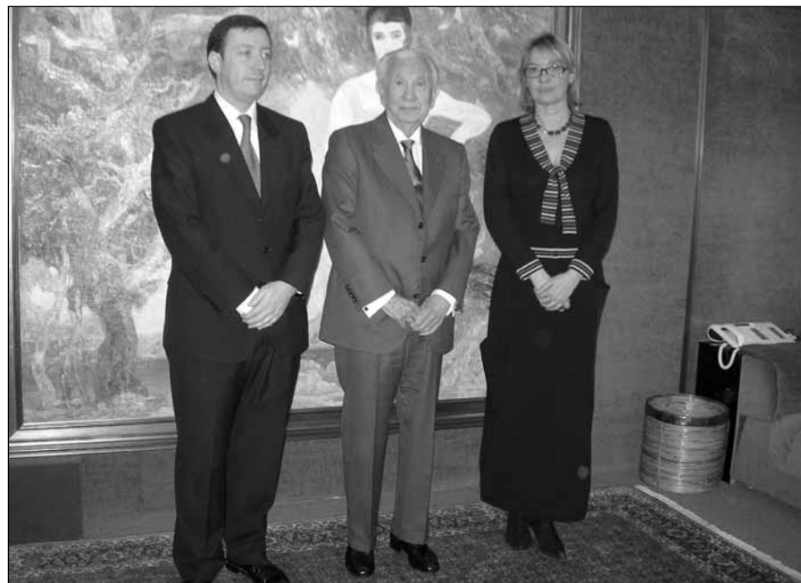
Presentación de la candidatura olímpica Jaca 2014 a Juan Antonio Samaranch