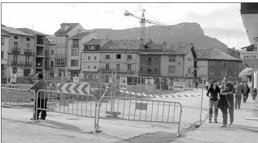
Obras de construcción del parking en la plaza Biscós