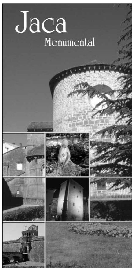
Portada del folleto «Jaca Monumental»

La primera intervención ha consistido en la remodelación interna del espacio de la oficina, hasta que pueda ser trasladada a la nueva ubicación en la plaza de San Pedro. Para ello se ha procedido al cambio de mobiliario y se han instalado unos paneles de vinilo donde se plasma la documentación gráfica de Jaca y comarca. La inversión realizada supera los 4.600 euros. Esta mejora se enmarca en un plan más ambicioso, que se desarrollará desde dicha concejalía, en colaboración con el sector turístico y comercial de la ciudad.