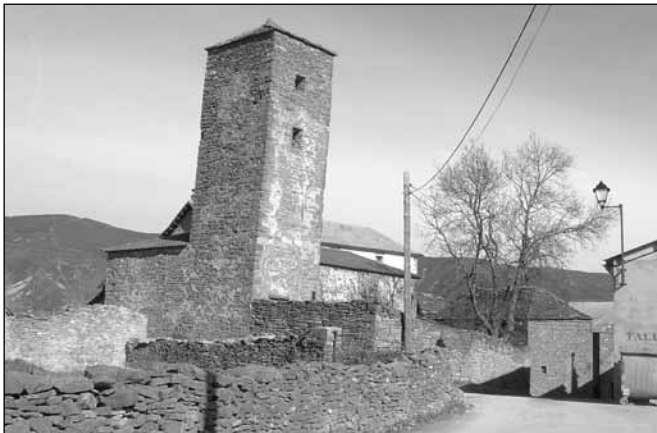
Gracionépel. Nueva red de agua y alumbrado público