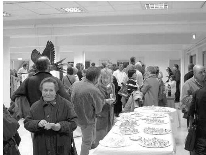
Sala de exposiciones