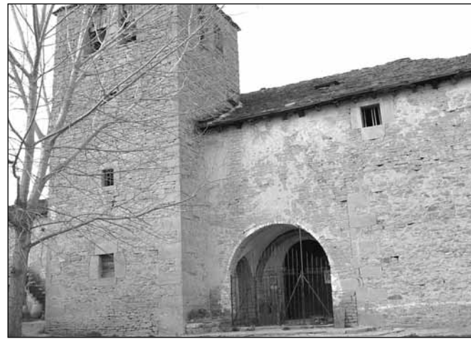
Osia. Nueva red de alumbrado público y alcantarillado