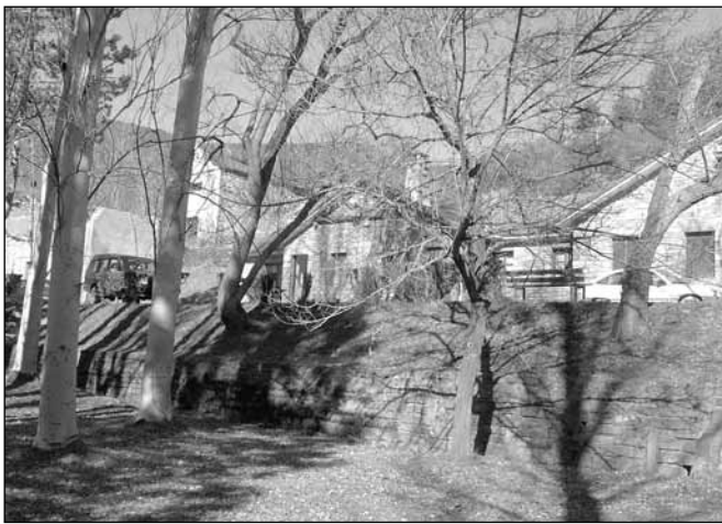
Bescós. Nueva red de alumbrado público

Con esta intervención, se consigue que todos los pueblos de Jaca tengan por fin alumbrado público de calidad.