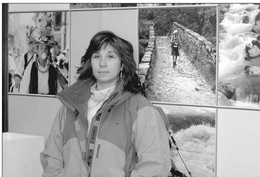
Begoña López Alcalá, concejal de Comercio y Turismo