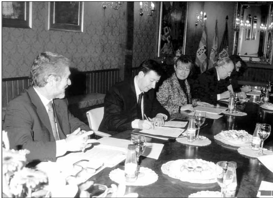
Firma de la constitución de la Fundación Jaca 2007

El jueves 12 de febrero se constituyó oficialmente en nuestro Ayuntamiento la Fundación para organizar el Festival Olímpico de la Juventud Europea 2007. Demostrar la capacidad organizativa y obtener unos buenos resultados deportivos, son los dos retos que se ha