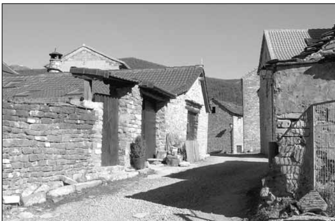
Villanovilla. Nueva potabilizadora y depuradora