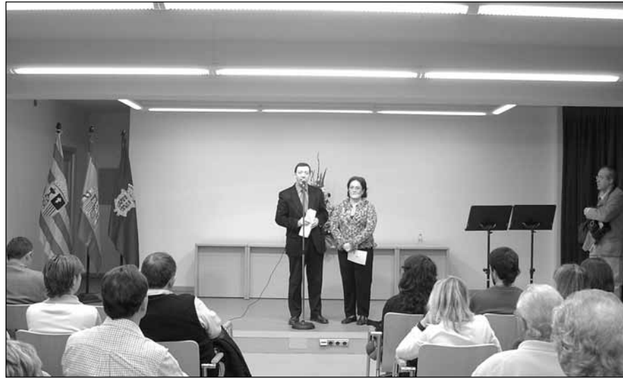
Acto de inauguración de la Casa de la Cultura «María Moliner»

La inauguración contó con la actuación musical de varios alumnos de la Escuela de Música y Danza “Pilar Bayona”. La nueva sala de exposiciones fue estrenada por los artistas locales con una gran exposición de pintura y escultura, naciendo a partir de la misma una nueva asociación denominada «Jac-Arte», dispuesta a colaborar y organizar actividades culturales en la ciudad.