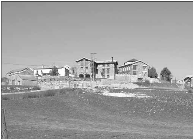
Ascara. Nueva red de alumbrado público