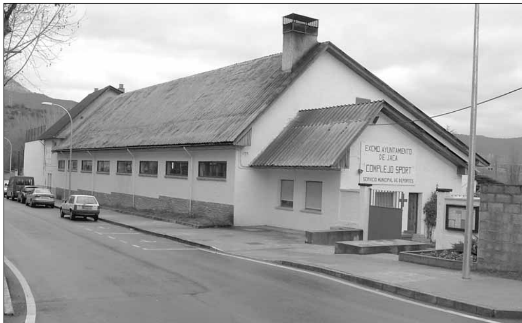
Piscina climatizada de Jaca

La planta baja acogerá tres áreas: la de recepción y administración con 125,28 metros cuadrados; la de vestuarios, servicios, almacén y aseos con 510,67 metros cuadrados; y la de piscinas, en la que se construirán tres vasos diferenciados: el principal, de carácter deportivo, medirá 25 por 12,5 metros y ocupará 325,50 metros cuadrados; la piscina lúdica se desarrollará en 63,12 metros cuadrados y el área termal en 76,56. Los vasos principal y de enseñanza serán construidos con estructura, perfiles y plancha de acero y con un canal de desbordamiento perimetral. La piscina lúdica se