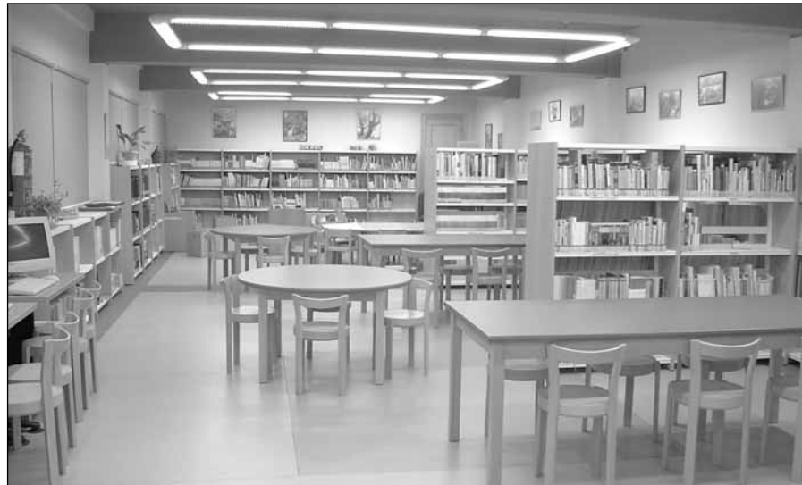
Biblioteca infantil y bebeteca