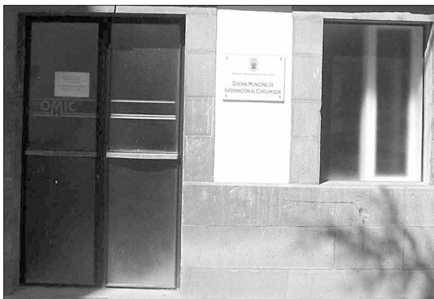
Oficina del Consumidor situada en la calle Ramón y Cajal de Jaca

Además de las demandas atendidas, la Oficina Municipal de Información al Consumidor ha realizado otras actividades durante el año pasado, entre ellas, la celebración del Día Mundial del Consumidor, con talleres de títeres en los colegios de Jaca, conferencias sobre "consumo, publicidad y sociedad", "ciudad y consumo", "derechos de los consumido-