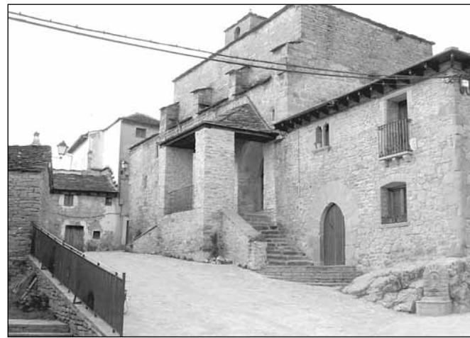
Botaya. Nueva red de alumbrado público