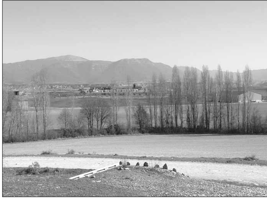
Terrenos cercanos a Martillué