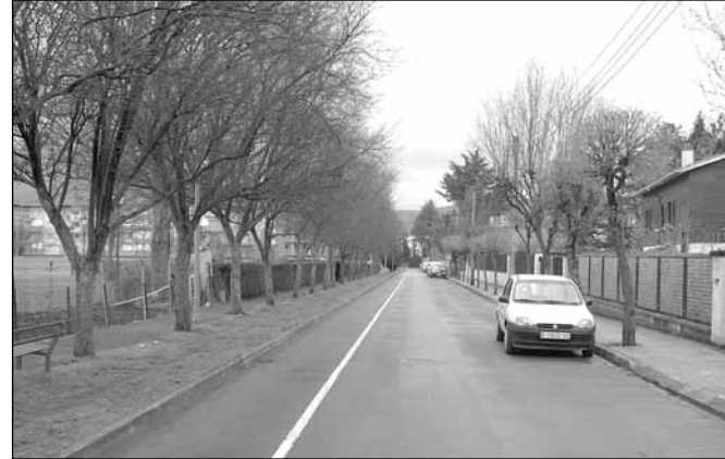
Calle Pico Collarada

También se ha aprobado el expediente de contratación para la ejecución de la obra de alumbrado público del sector avenida de Francia y calle Pico Collarada, con un presupuesto de 243.391 euros. Se colocarán 65 báculos de 3,2 metros de altura, lo que aumentará la iluminación un 200 %, se ampliará el cuadro de potencia instalando puntos de luz de baja altura en disposición bilateral y se realizarán nuevas redes de alumbrado.