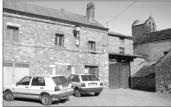
Baraguás. Nueva red de agua y alumbrado público