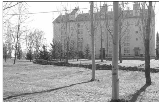
Terrenos donde se construye el nuevo parque infantil

La Comisión de Gobierno del Ayuntamiento de Jaca ha adjudicado la obra civil del parque infantil situado en la avenida Juan XXIII, en el barrio Norte. Tiene una superficie de 3.579 metros cuadrados y un presupuesto de ejecución de 146.257,53 euros. En la próxima primavera estará finalizado este nuevo parque, que contará con tres zonas de juegos diferenciadas por edades.