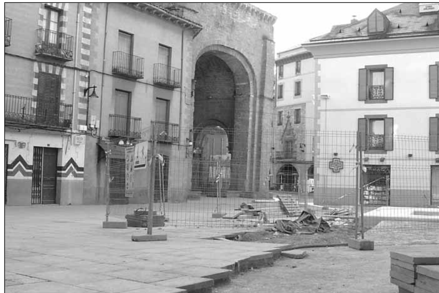
Plaza de San Pedro