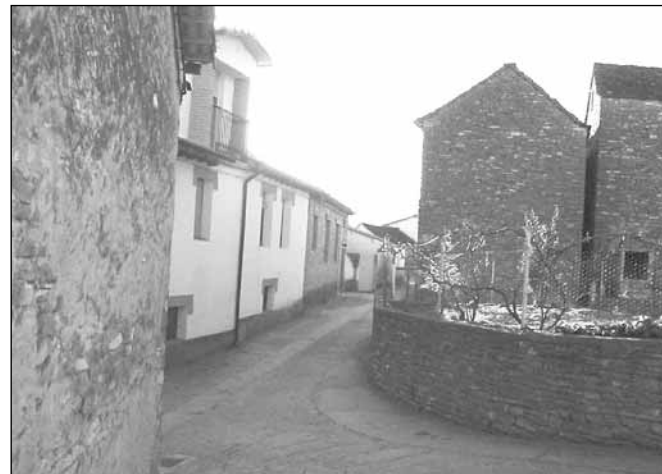
Novés. Nueva red de alumbrado público y rehabilitación de la herrería