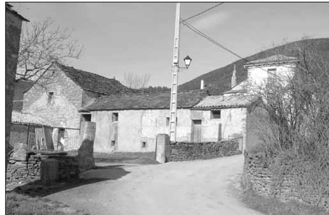
Lerés. Nueva red de agua y alumbrado público