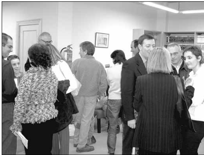
Zona de videoteca y fonoteca