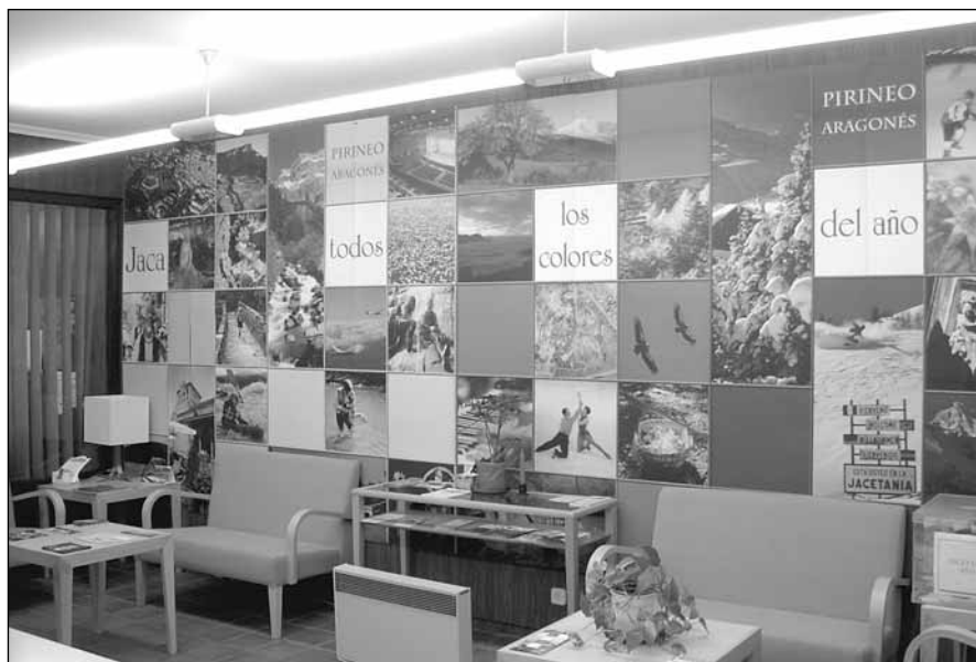
Oficina de Turismo de Jaca

El folleto «Jaca Excursiones», propone ocho sencillas rutas para los visitantes que desde Jaca quieran conocer otros parajes y localidades de nuestra comarca. Se incluyen también dos mapas, uno