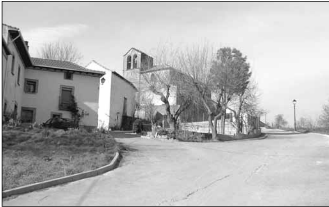
Guasa. Nueva red de agua y alumbrado público

cabo la rehabilitación del centro social de Baraguás. Las obras previstas son el arreglo de la cubierta, la construcción de una nueva escalera de acceso a la primera planta y la instalación de aseos y una nueva red de evacuación de aguas residuales. La techumbre estará impermeabilizada y el tejado será de teja. También se colocaran canalones y bajantes para recoger las aguas pluviales. La superficie construida es de 179,71 metros cuadrados en planta baja, la misma superficie en la planta primera y de 98,86 metros cuadrados bajo cubierta.