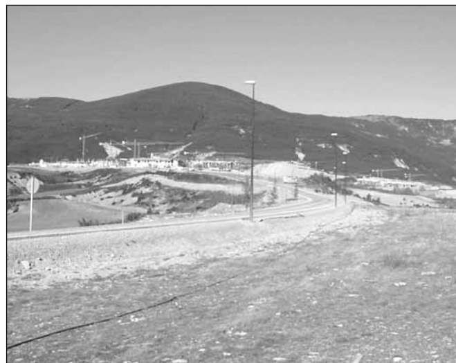
Urbanización «Lomas de Badaguás»