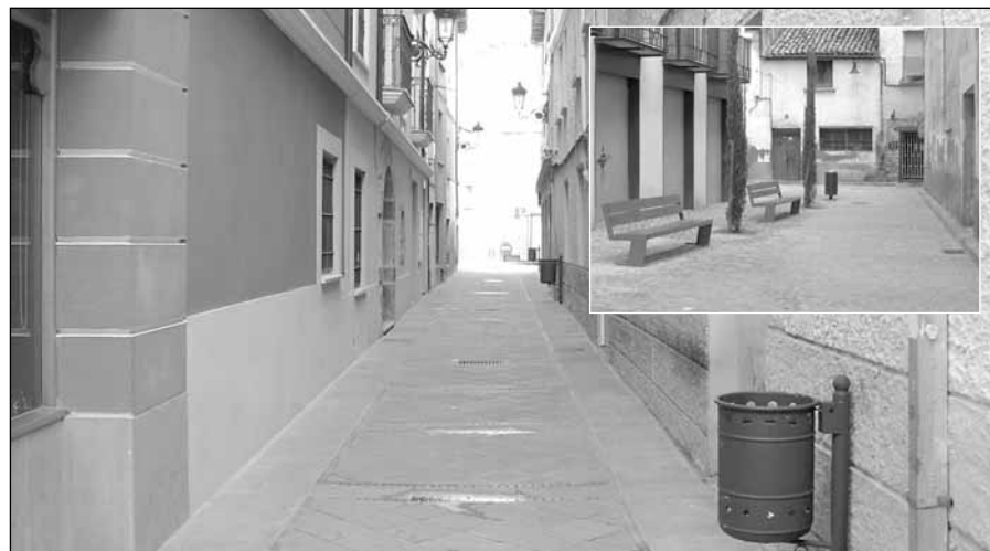
Calle del Deán

Con un presupuesto total de 76.175,15 euros se ha remodelado la calle del Deán. La obra consistió en renovar todas las redes de agua y alcantarillado y enterrar las redes de telefonía, electricidad y gas. Después se procedió a la renovación total del pavimento, con la utilización de piedra de Fiscal, la eliminación de las aceras y la recogida de las aguas pluviales mediante un canal central de evacuación que discurre por el subsuelo.