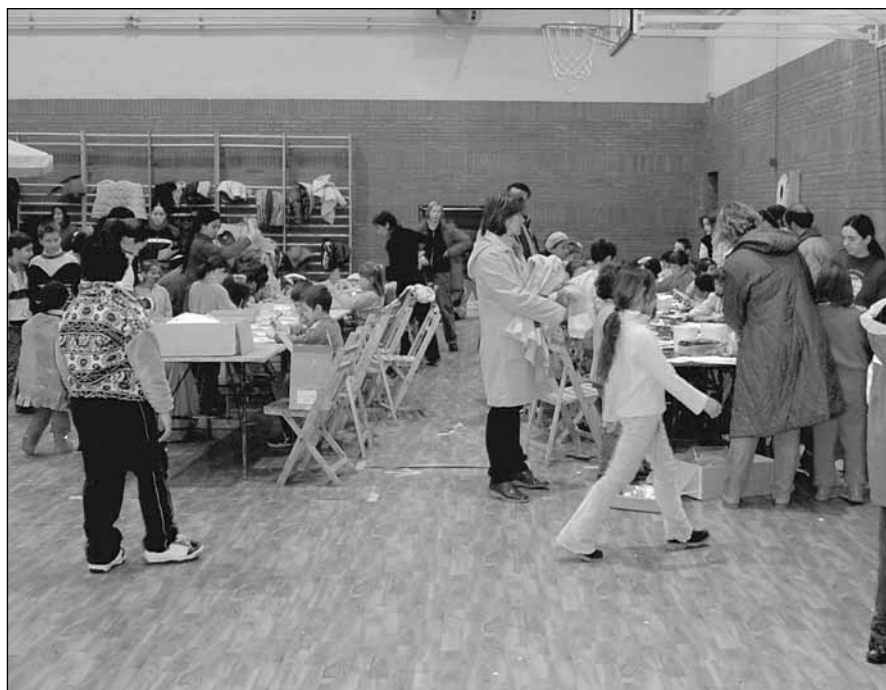
Parque infantil «Pirichiquis»

Enmarcados en la semana de carnaval, algunos de los talleres giraban alrededor de esta temática. Entre las actividades desarrolladas destacan la ludoteca, hinchables, futbolines y play stations, además de talleres de maquillaje y máscaras de carnaval, de