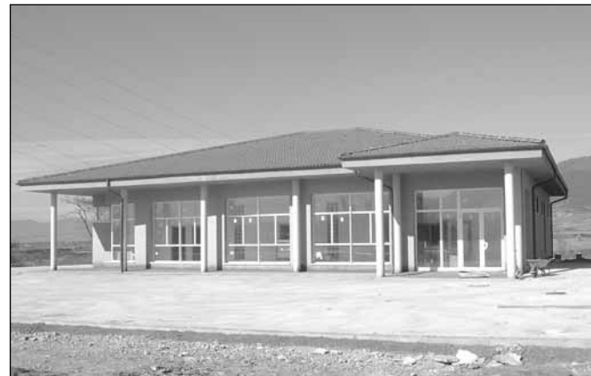
Nuevo tanatorio de Jaca

Se ha terminado la construcción de una obra muy demandada en la ciudad de Jaca como es el tanatorio. Situado en el Llano de la Victoria, con fácil acceso y con unas instalaciones modernas, prestará un servicio muy necesario en nuestros días.