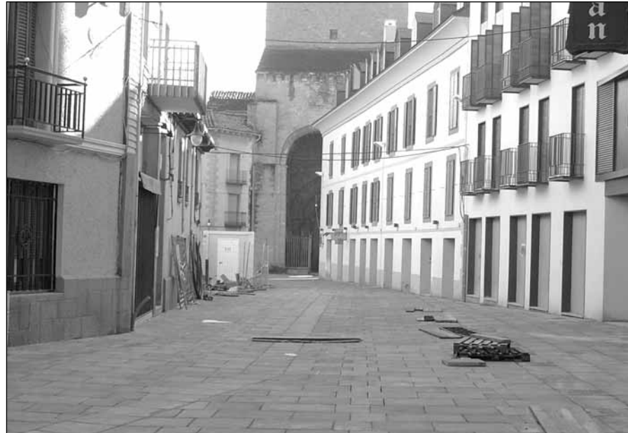
Calle Santa Orosia

El proyecto final contempla la creación de un espacio abierto con zonas de descanso, arbolado y bancos y con una iluminación adecuada que resalte el conjunto. Además, se instalarán dos jardineras con árboles de pequeño tamaño, así como un monolito y una maqueta que haga referencia a los hallazgos encontrados entre los muros y las estructuras del antiguo templo de San Pedro.