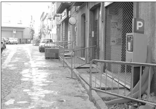
Renovación de aceras en calle Ramiro I

Ha finalizado recientemente la renovación de las aceras de la calle Ferrenal, Coso, Campoy Irigoyen y Avenida de la Jacetania. Actualmente están en obras las aceras de la calle Ramiro I. El Ayuntamiento de Jaca tiene previsto continuar con la renovación de las calles Correos, Domingo Miral, Madrid y Avda. Escuela Militar de Montaña.