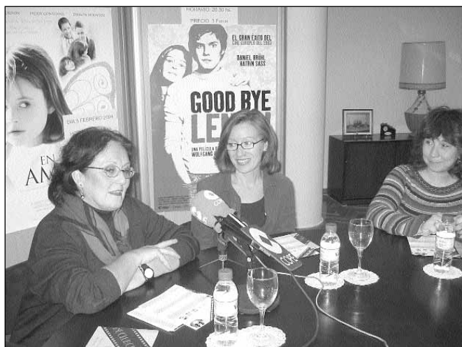
Acto de presentación del ciclo de cine

Se ha distribuido entre los espectadores un cuestionario que recoja sus pareceres y opiniones para mejorar el funcionamiento de esta actividad.