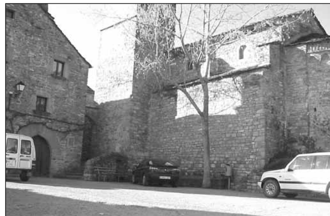
Banaguás. Rehabilitación del Centro Social