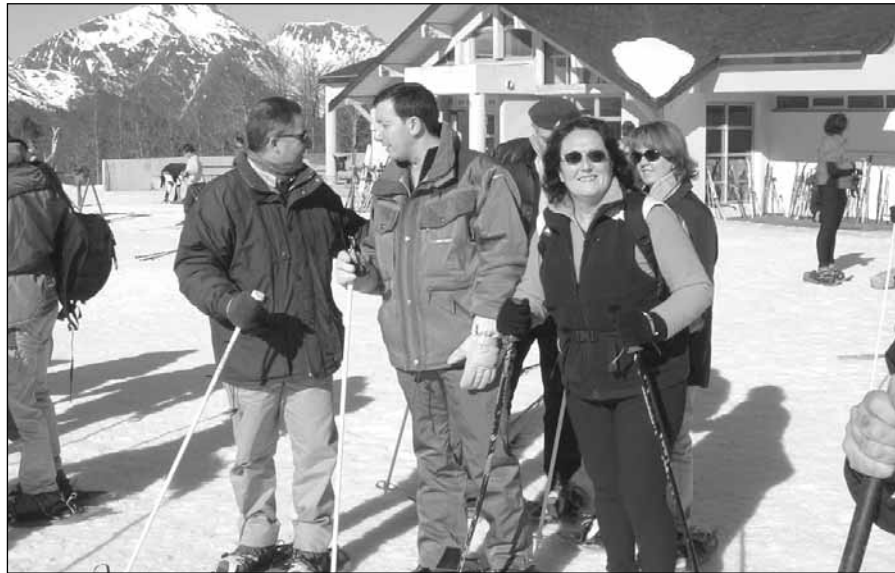
Participantes en el acto reivindicativo del Camino aragonés en Somport