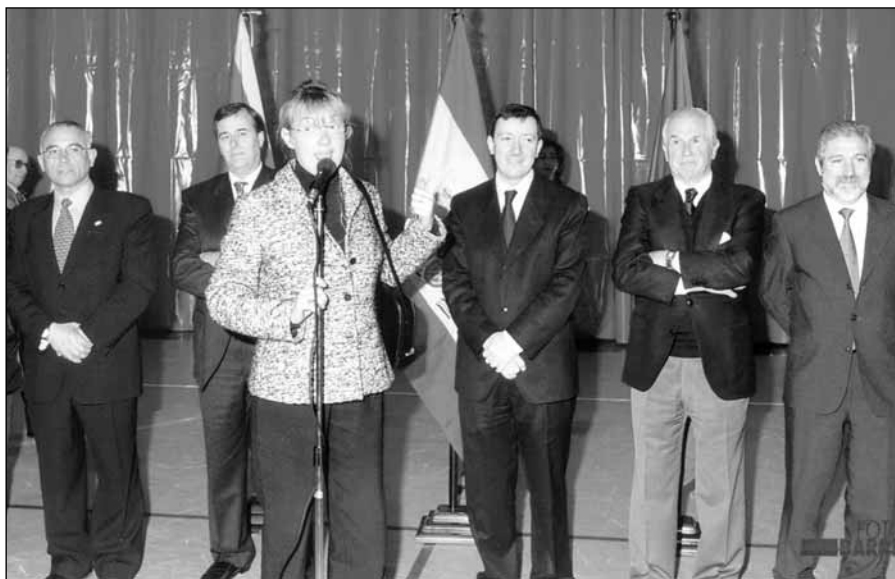
Acto de la inauguración del polideportivo