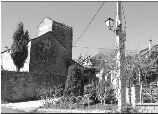
Martillué. Nueva red de alumbrado público