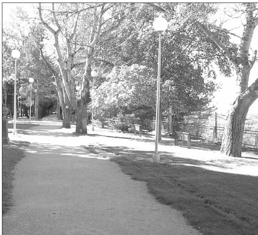
Paseo de la Cantera

Se han editado mil ejemplares de cada espacio verde que se han distribuido en los centros de enseñanza y se pueden adquirir en la oficina de Turismo.